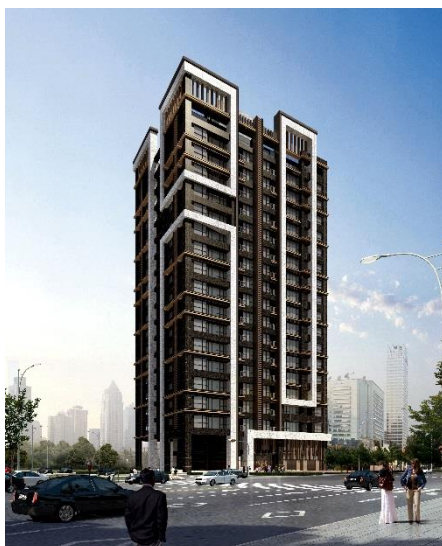
「(仮称)三重中興橋プロジェクト」完成予想パース